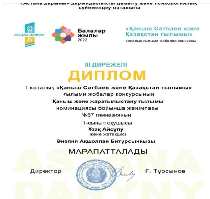
(1 сурет. Ұзақ Айсұлудың жетістігі)

1999 жылғы 12 сәуірде Қ. И. Сәтбаевтың туғанына 100 жыл толды. Ол ЮНЕСКО-ның бүкіл дүниежүзілік ұйымдары атаулы күндерінің қатарында мереке болып енді.